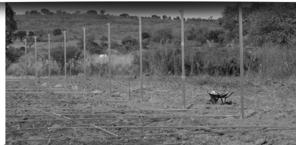
CONSTRUCCIÓN DE INVERNADERO PARA LA PRODUCCIÓN DE JITOMATE Y CHILE

El departamento de Desarrollo Rural trabaja para mejorar la calidad de vida de la población rural, a través de la planeación y organización de la producción agropecuaria y forestal, y otros bienes y servicios que ayuden a elevar el nivel de vida en Zapotlanejo.